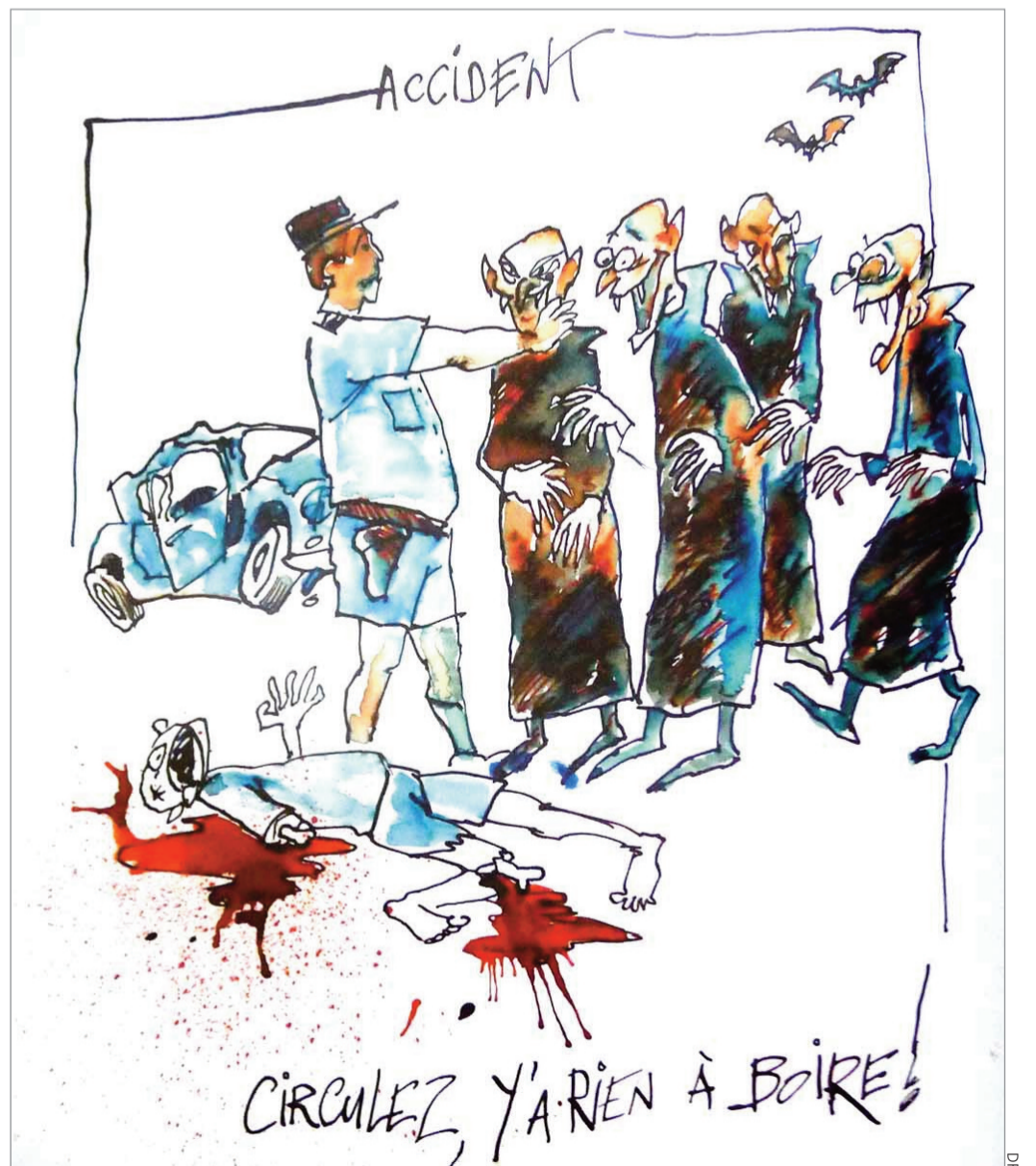
C'EST À VOIR, À VOIR, À VOIR... c'est à voir qu'il nous faut.