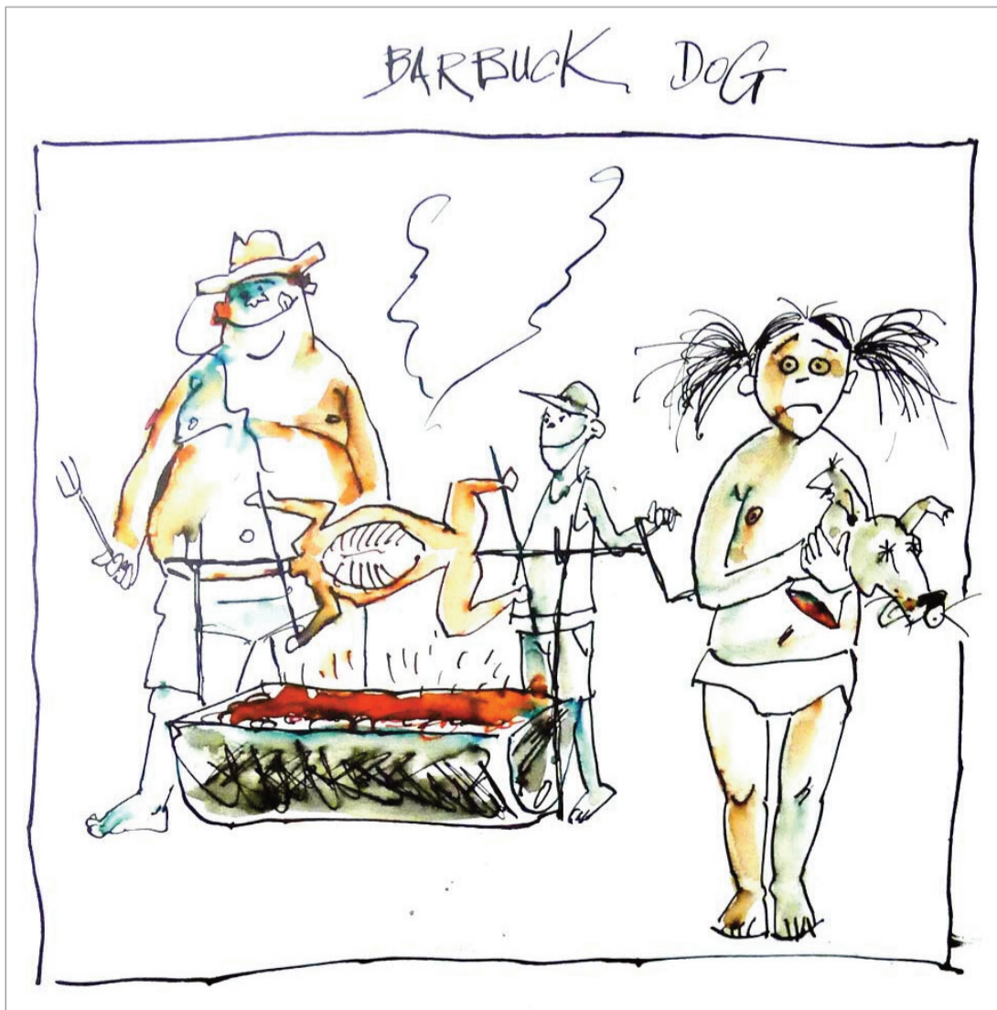
LES BARBECUES NE SONT PAS TOUJOURS CE QUE L'ON CROIT. Heureusement qu'une tête traîne, histoire de savoir ce qu'on mange.

DES CLICHÉS ET QUELQUES VÉRITÉS, le tout dessiné d'une plume acérée. L'Humour de ma vie est une bouffée de gaz hilarant qui tombe bien en ces temps d'économie plombée.